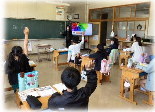
5年生 社会「地球の姿を知ろう」