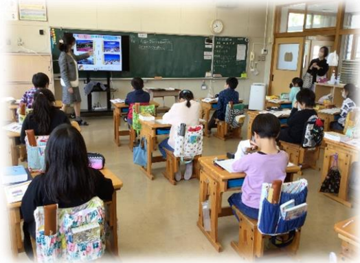
4年生 算数「折れ線グラフ」